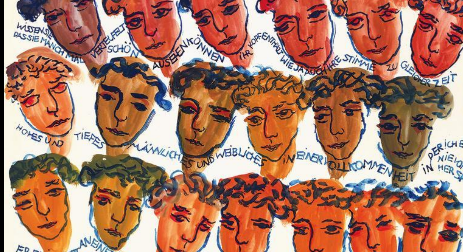
Charlotte Salomon, Leben oder Theater , 1940-42.