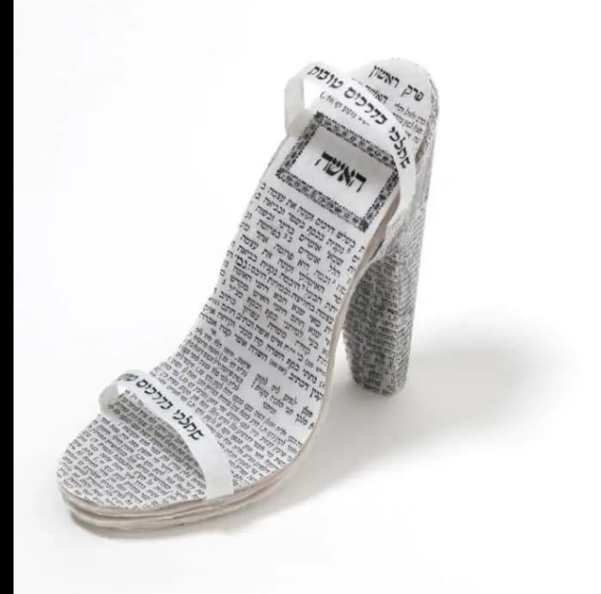
Nechama Golan, "You Shall Walk in Virtuous Ways", 2011.