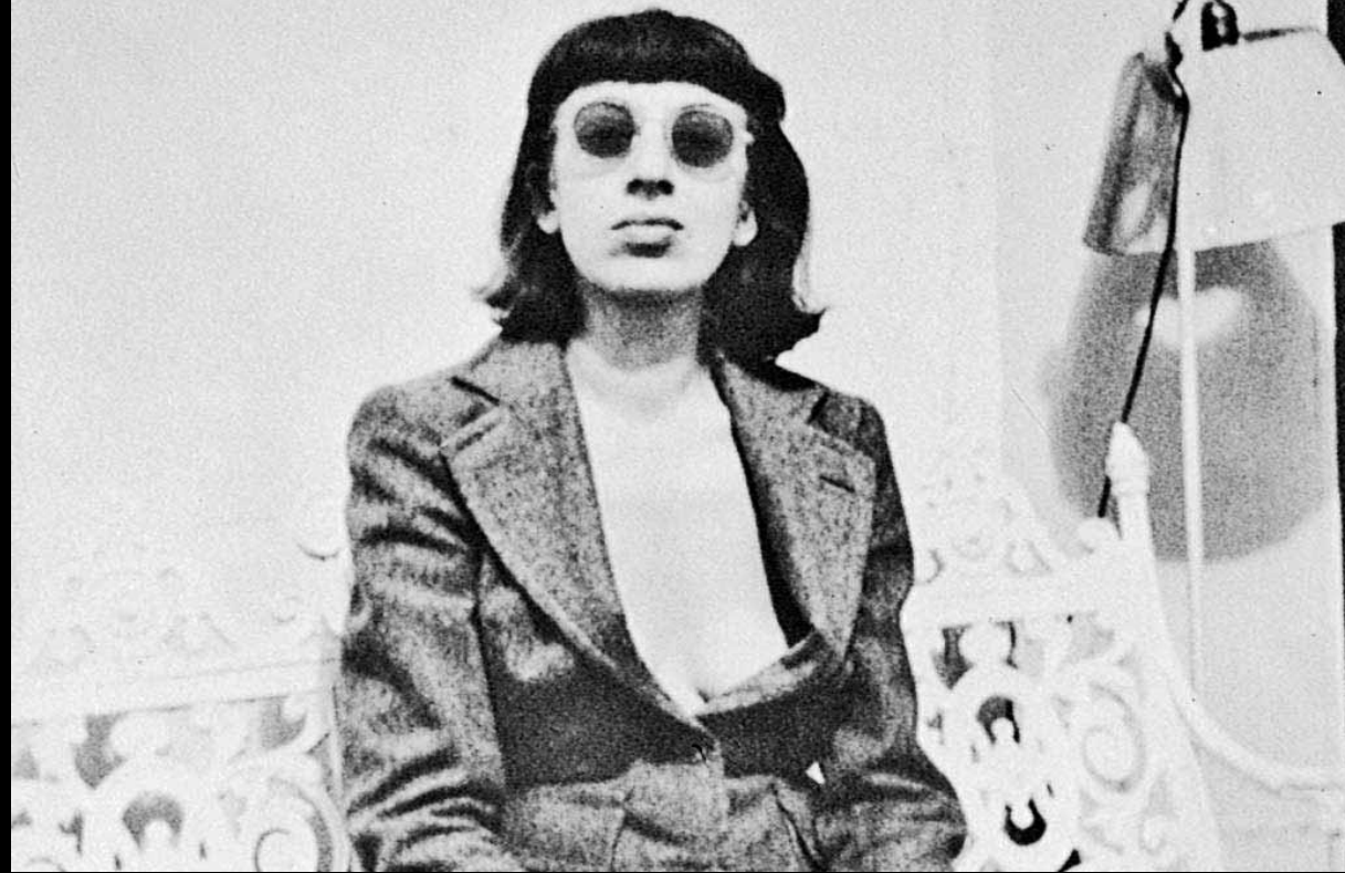
Lee Krasner, New York, 1984.