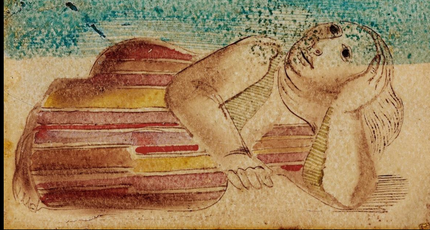
Jankel Adler, Ruhende, 1926.