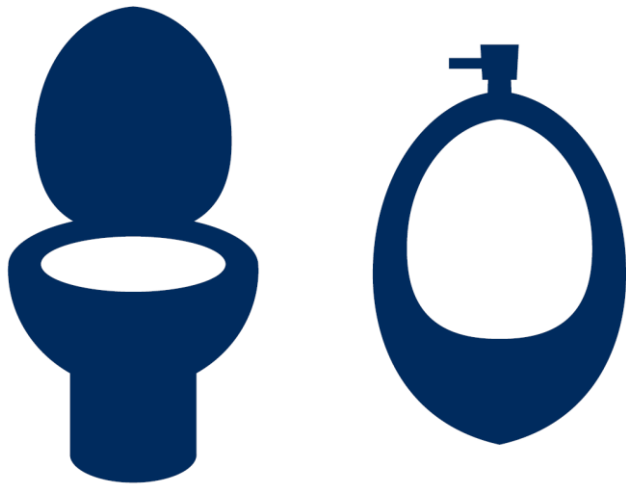
WC, barrierefreie Toilette, WC und Pissoir