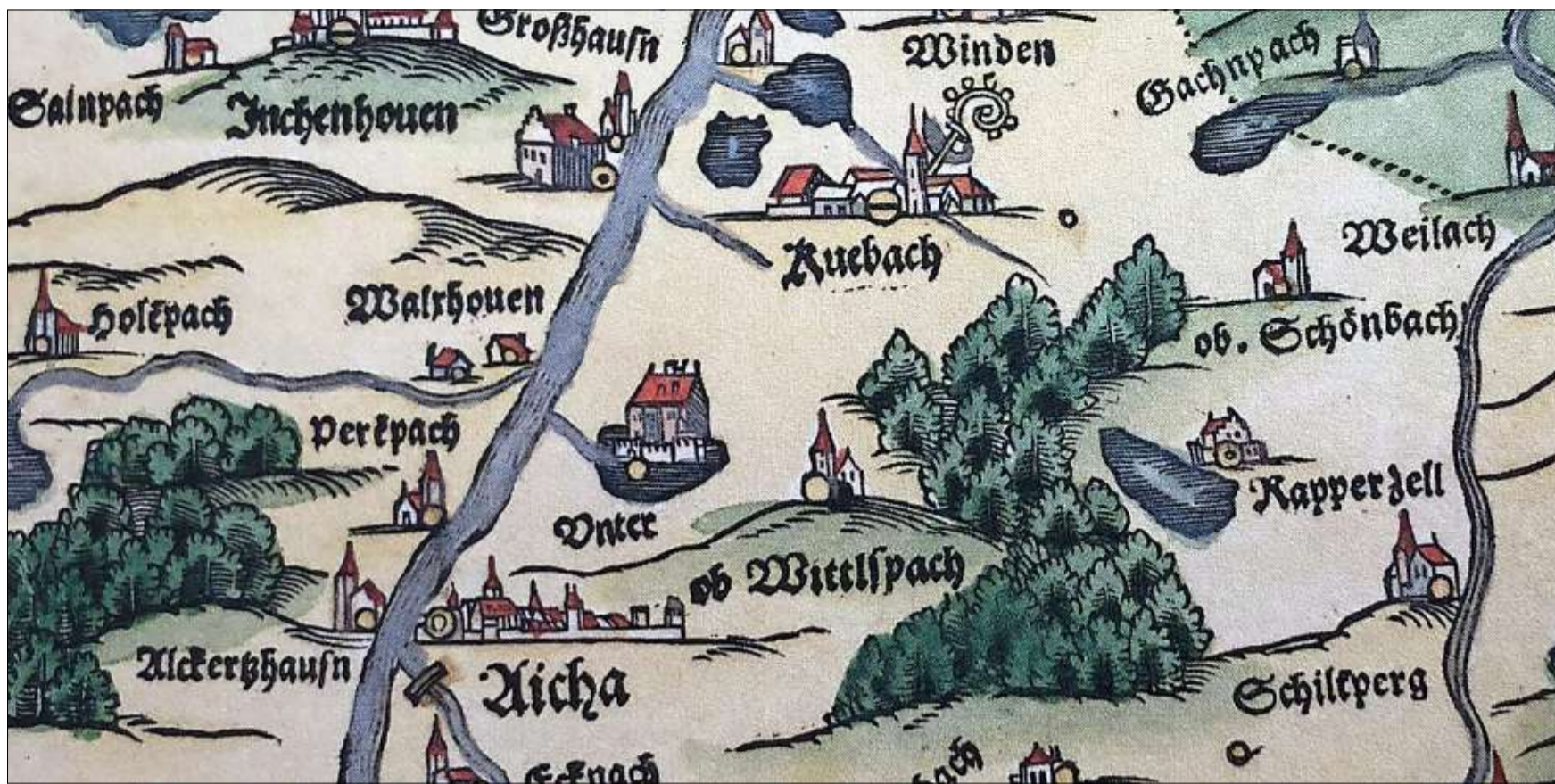
Die historische Karte ist auf dem Cover des Buches zu sehen und zeigt einige alte Schreibweisen von Ortsnamen.